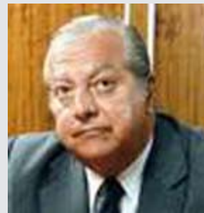
Enrique Tarigo Abogado Profesor de la Facultad de Derecho Vicepresidente de la República Director Fundador de OPINAR

En esa proliferación de calificativos, que en épocas y en circunstancias diversas han pretendido adosársele a la democracia, no han faltado los que, desde trincheras opuestas a las del marxismo, concluyen, sin embargo, por arribar a una conclusión idéntica: la negación de la democracia.