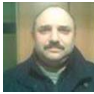
Santiago Tricánico Periodista - Escritor

Enredado en su propio tejido, el sistema político uruguayo ha ingresado en un callejón sin salida en el tema de la ley de salud reproductiva. Mientras el presidente Vázquez anuncia que vetará cualquier ley que se aprueba, incluso el de la senadora de su Partido Socialista, Mónica Xavier, diversas organizaciones sociales y de derechos humanos han manejado la posibilidad de una enmienda constitucional que permita plebiscitar un texto de ley sobre el particular. La lucha electoral, el miedo a perder el voto católico, y los compromisos pre-electorales ante distintos grupos de mujeres, mantienen en la picota a muchos sectores políticos.