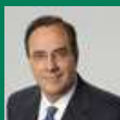
Carlos ALBERTO MONTANER

¿Cree Silvio Rodríguez en la revolución que defiende?