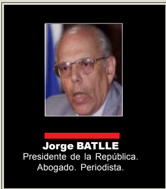
Jorge BATLLE Abogado de la República. Abogado. Periodista.